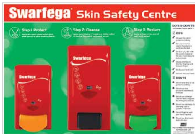
A képen SSC1EACH található

Az utókezelés a végső rész a 3 lépésben, a bőr természetes nedvességének helyreállításával segít megelőzni a kirepedezett és száraz kezeket. Az ilyen krémek rendszeres használata segít a bőr egészséges állapotának fenntartását.